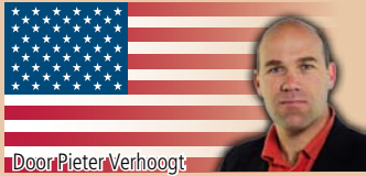
Door Pieter Verhoogt

In 1990 eiste de Belgische voetballer Jean-Marc Bosman via de rechter de vrijheid om na afloop van zijn contract met FC Luik te gaan en staan waar hij wilde. Het Europese Hof stelde hem in het gelijk en veroordeelde daarmee het gebruik van clubs om spelers zelfs na afloop van hun contract met hoge transfersommen aan zich te binden. Het Bosman-arrest sloeg in als een bom en zorgde voor een revolutie in de verhouding tussen clubs en spelers. Opvallend is dat in Noord-Amerika al in de jaren zeventig exact hetzelfde was gebeurd. De Amerikaanse Bosman heette Curt Flood.