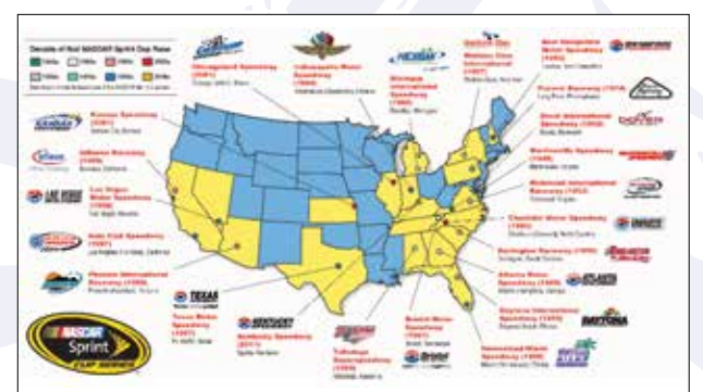
FIGUUR 4 DE EXPANSIE VAN DE NASCAR-COMPETITIE.

Het eerste kampioenschap werd in 1949 verreden en bestond uit acht races. Zeven daarvan vonden op onverharde circuits plaats en één op het zand- en straten-circuit in Daytona Beach. De Daytona 500 is nog altijd het paradepaardje van de Sprint Cup.