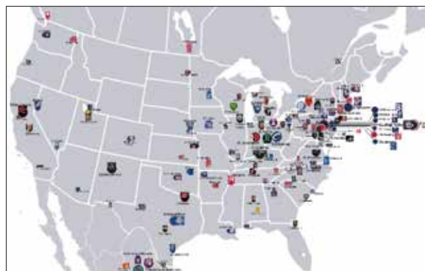
FIGUUR 2 DE MEEST POPULAIRE MINOR LEAGUE-TEAMS IN DE VERENIGDE STATEN.

In deze zogenaamde Minor Leagues komen 250 tot 350 teams uit, die zijn verdeeld over verschillende niveaus. AAA (triple A) is het niveau direct onder de Major Leagues. Daaronder hangen nog de AA, A en Rookie League. Vrijwel alle Minor League-teams opereren als zelfstandige sportorganisaties en fungeren als opleidingsteams