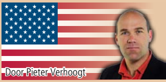
Door Pieter Verhoogt

Opvallende uitspraken uit de Amerikaanse sport