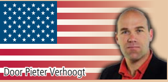
Door Pieter Verhoogt

Had u er al van gehoord? Amerika is weer een professionele sportcompetitie rijker. In november 2012 presenteerde de Professional Bowlers Association (PBA) haar plannen voor de PBA League, een innovatief concept waarmee zij de bowlingsport een nieuwe impuls hoopt te geven. De PBA League is de nieuwste loot aan de stam van de PBA. Professioneel bowlen heeft in Amerika echter al een lange geschiedenis. The American Way kijkt met u terug naar de lange aanloop naar deze nieuwe profleague.