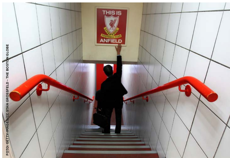
JOHN HENRY HEEFT LATEN ZIEN DAT ZAKEN ALS HISTORIE, SPORTIEVE KWALITEIT EN MAATSCHAPPELIJKE IMPACT ERTOE DOEN EN HET WAARD ZIJN OM BLIJVEND IN TE INVESTEREN.

verwerft NESV ook Anfield Stadium, het prachtige oude stadion waar Liverpool sinds 1892 zijn thuiswedstrijden speelt. Niet onverwacht is Liverpool sinds de overname een van de koplopers in de Premier League waar het gaat om het gebruik van voetbaldata en statistische analyses. En ook hier volgt na een lange droogte het succes. In 2019 wint de club de UEFA Champions League en in 2020 wordt Liverpool voor het eerst sinds dertig jaar weer landskampioen.