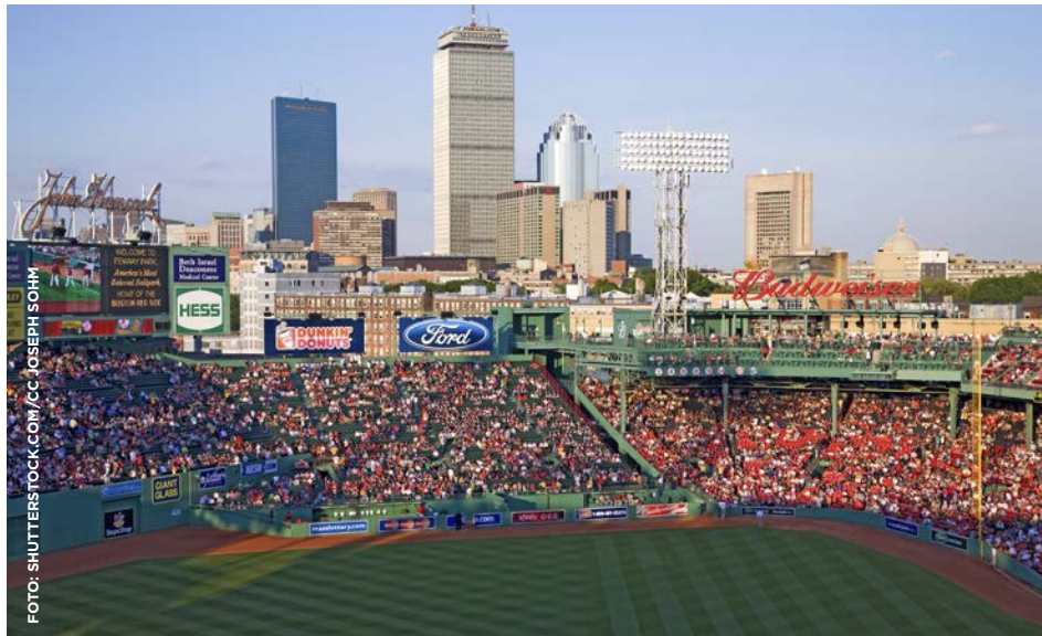
FENWAY PARK, THUISBASIS VOOR DE BOSTON RED SOX, IS EIGENDOM VAN DE FENWAY SPORTS GROUP.

Enkele jaren later zet het investeringsconsortium zichzelf wereldwijd op de kaart door, na een korte flirt met Fulham FC, op 6 oktober 2010 de aankoop van Premier League-club Liverpool bekend te maken. NESV neemt voor bijna 500 miljoen dollar alle aandelen over van de Amerikaanse eigenaren George Gillett en Tom Hicks, die door het clubbestuur min of meer worden gedwongen hun aandelen te verkopen. Naast de traditierijke club