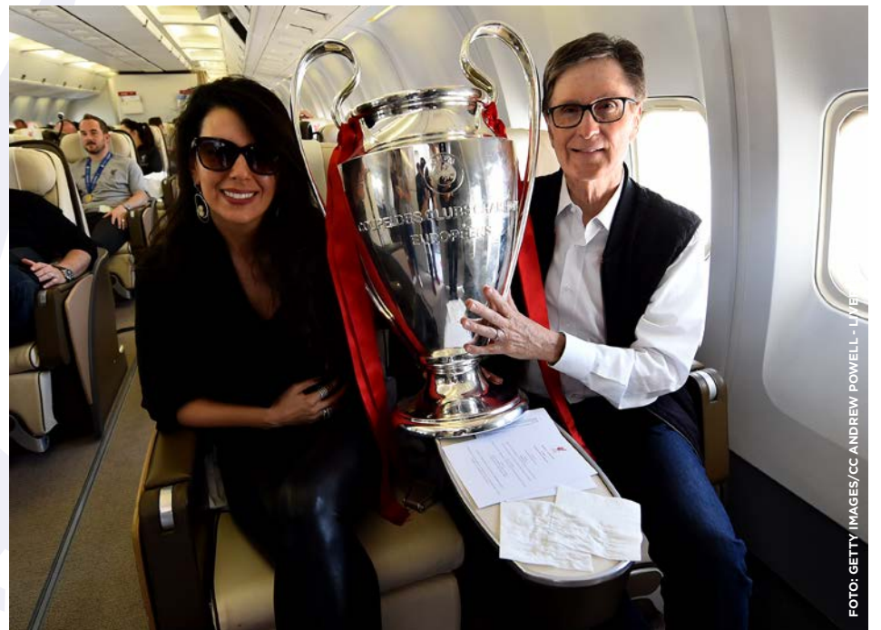
L'JER DE BEMOEIENIS VAN HENRY MET LIVERPOOL BLEEF NIET ZONDER SUCCES: IN 2019 WINT DE CLUB DE UEFA CHAMPIONS LEAGUE EN IN 2020 WORDT LIVERPOOL VOOR HET EERST SINDS DERTIG JAAR WEER LANDSKAMPIOEN.

Het verhaal van de Fenway Sports Group begint bij John Henry (1949), een boerenzoon uit Illinois, die tijdens zijn studie besluit dat zijn toekomst niet ligt op de sojaboerderij van zijn ouders, maar in de handel. Hij ontwikkelt zich tot een zeer succesvolle termijnhandelaar in soja, graan, mais en grondstoffen. Henry maakt daarbij gebruik van een zelfontwikkeld systeem voor het automatisch volgen, analyseren en voorspellen van marktkoersen. Vanwege het succes van zijn analytische aanpak wordt Henry al na enkele jaren door grote handelaren en investeringsmaatschappijen gevraagd om hun investeringen te managen. Het zakelijk succes maakt van hem een vermogend man, die naast het geld van zijn cliënten ook zijn eigen vermogen slim weet te investeren. In 2021 wordt zijn eigen vermogen geschat op ruim 3 miljard dollar.