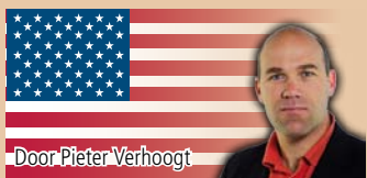
Door Pieter Verhoogt

Van 26 tot 28 april vindt in de Radio City Music Hall in New York de 2012 NFL Draft plaats. In zeven ronden mogen de 32 NFL-teams hun keuze maken uit de beschikbare collegetalenten die zichzelf rijp achten voor het professionele football. De draft zelf hebben wij al eerder besproken. In deze aflevering van The American Way kijken we naar enkele fascinerende gebeurtenissen in de aanloop naar de draft .